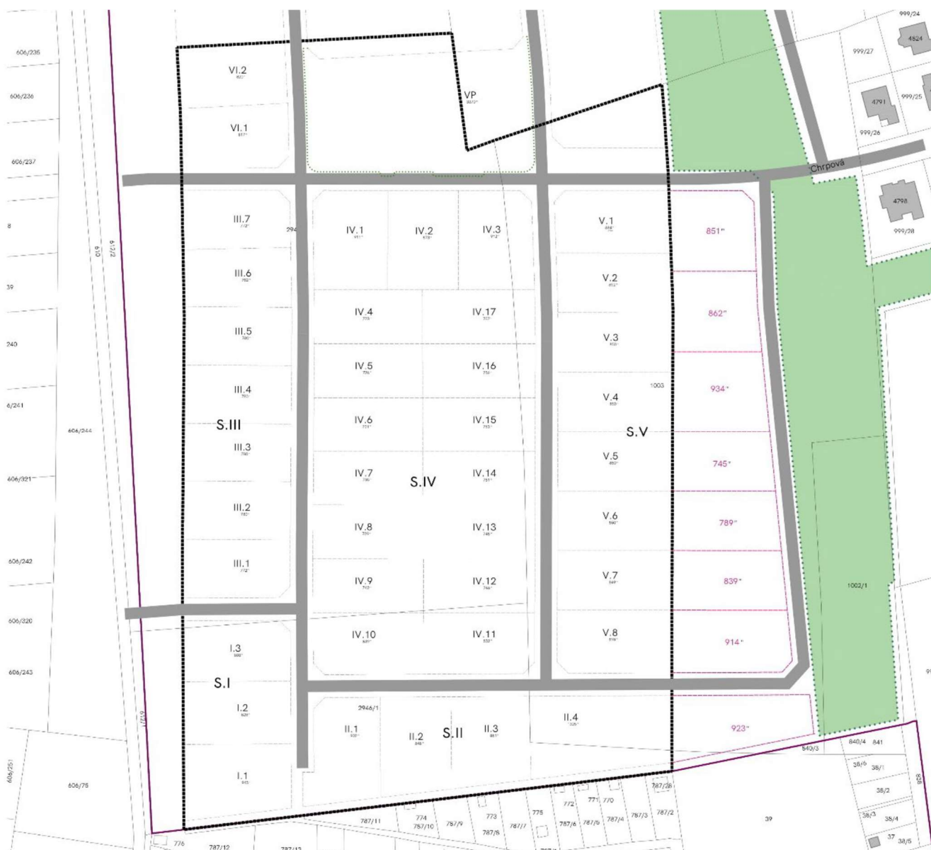
Obrázek 3: Orientační podkladová studie (fialově je označeno navrhované rozšíření)